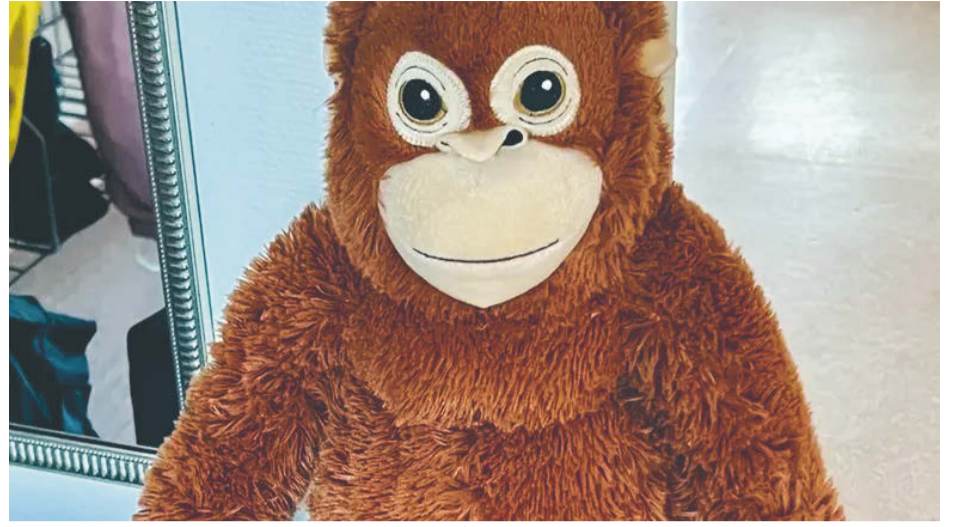
Henry tar med barnen på ett svängigt djungeläventyr.