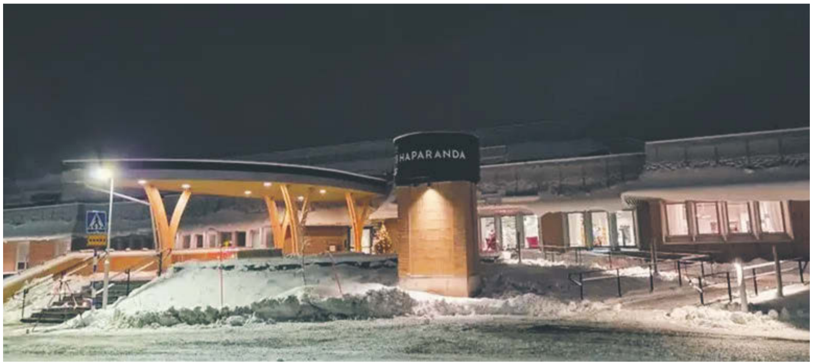
Haparanda stadsbibliotek.