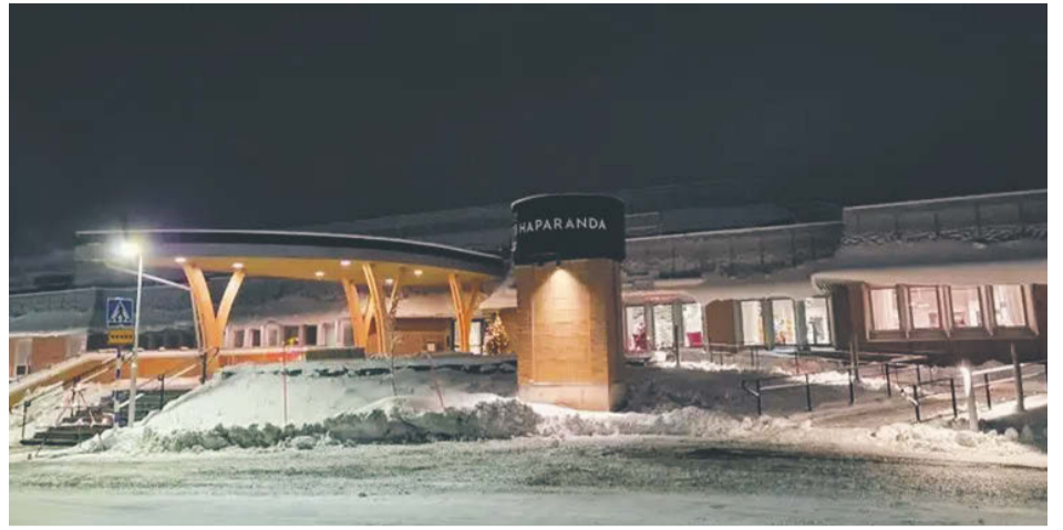
Haparanda stadsbibliotek.

HAPARANDA GRATISTIDNING haparanda.gratistidning.com