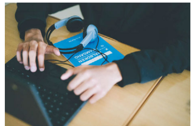
Läxhjälpen satsar digitalt för att nå elever i hela landet.

Samtidigt visar rapporter att elever i glesbygd har sämre förutsättning-