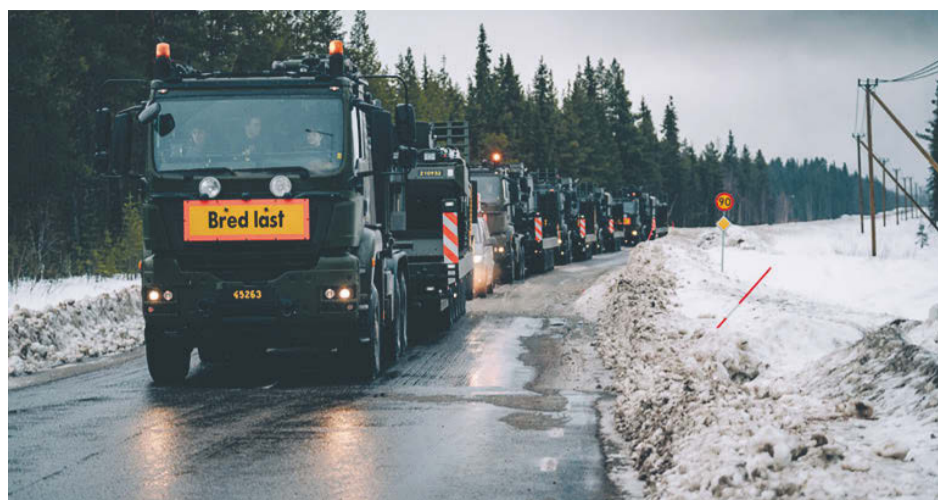
Under januari till mars kommer Försvarsmakten att genomföra flera militära transporter i norra Sverige.

Din mentala hälsoinspiratör Tina Persson, numera Östersund