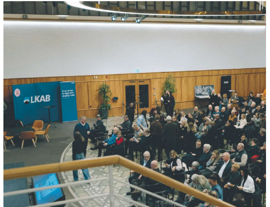
Den 12 februari samlades omkring 200 Luleåbor på Vetenskapens Hus för ett öppet informationstillfälle om den pågående industri- och samhällsomställningen i Luleå.

Bland åhörarna fanns studenter från Luleå tekniska universitet som arbetar med examensarbeten kopplade till industrin, medarbetare från olika verksamheter samt invånare som ville få en samlad bild av utvecklingen. Frågorna handlade om hur satsningarna påverkar staden, miljön och arbetsmarknaden – men också om möjligheterna som