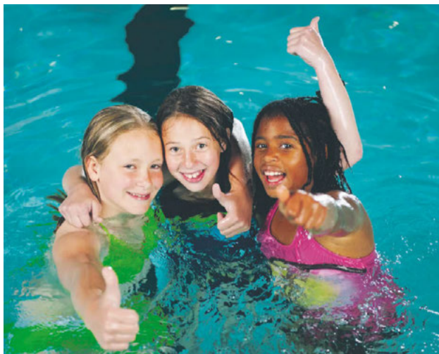
Simkunnighet är en grundläggande livsfärdighet och en fråga om barns rätt till trygghet.